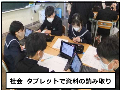
社会 タブレットで資料の読み取り