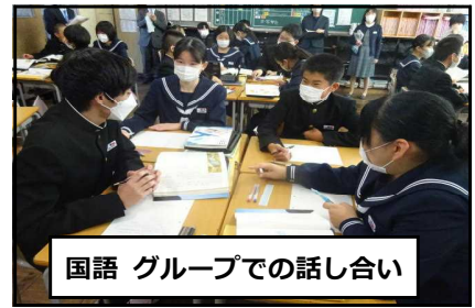
国語 グループでの話し合い