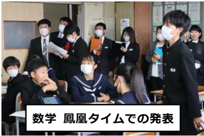
数学 鳳凰タイムでの発表