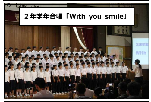
2年学年合唱「With you smile」