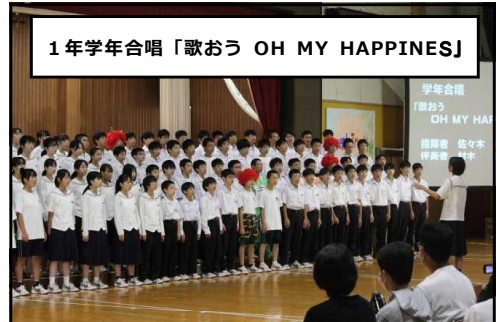
1年学年合唱「歌おう OH MY HAPPINES」