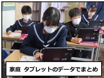
家庭 タブレットのデータでまとめ